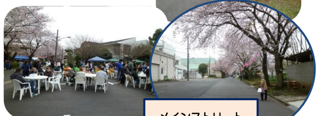
メインストリート 桜のトンネル

曇り空ではありましたが暖かな陽気で、何と言っても満開のさくらの中でのお花見会となり、大変多くのお客様で賑わいました。各店舗で行列が見られ、早くから品切れのお店もあったようです。