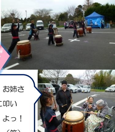
市原天翔太鼓の皆さん